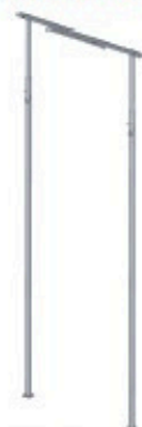
Etai double 3 à 5m Réf: 300 834