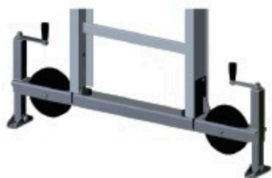
Châssis de base sur roues Réf: 901 283