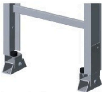
Jeu de pieds articulés Réf: 901 275