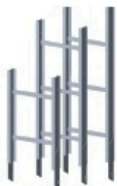
Elément intermédiaire de 1 m Réf: 901 250 Elément intermédiaire de 1.50 m Réf: 901 251 Elément intermédiaire de 2 m Réf: 901 144