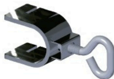
Collier de montage vertical pour échafaudage Réf: 901 260