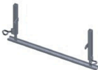
Appui de genouillère 0.15 à 0.40m Réf: 901 255