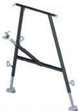
Appui de tête 0.90 à 1.50 m Réf: 901 256