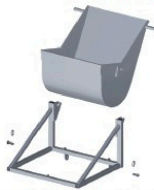
Benne basculante réversible 60 litres Réf: 901 254