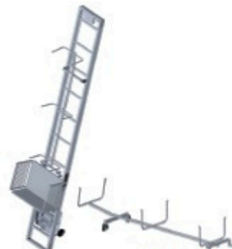
Support liteaux Réf: 901 285