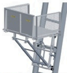
Régleur d'inclinaison pour caisse Réf: 901 300