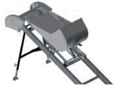
Benne 85 L avec système de basculement Réf: 901 257