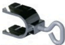
Collier de montage vertical pour échafaudage Réf: 901 260