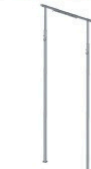
Etai double 3 à 5m Réf: 300 834