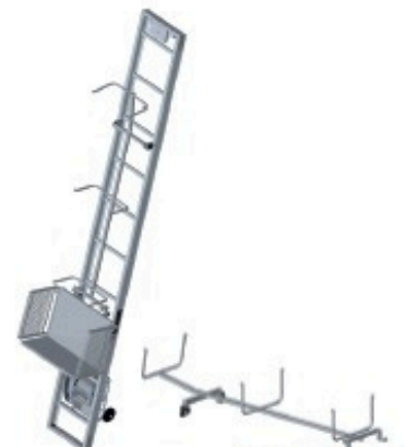
Support liteaux Réf: 901 285