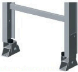
Jeu de pieds articulés Réf: 901 275