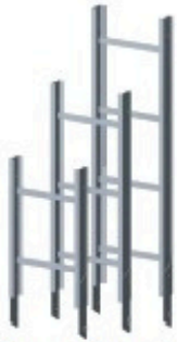
Élément intermédiaire de 1 m Réf: 901 250 Élément intermédiaire de 1.50 m Réf: 901 251 Élément intermédiaire de 2 m Réf: 901 144