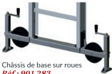
Châssis de base sur roues Réf: 901 283