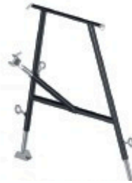
Appui de tête 0.90 à 1.50 m Réf: 901 256