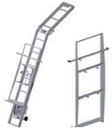
Porte-panneau 0.90 x 2.20 m Réf: 901 279