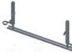
Appui de genouillère 0.15 à 0.40m Réf: 901 255