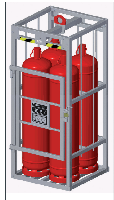
Bouteilles non fournies